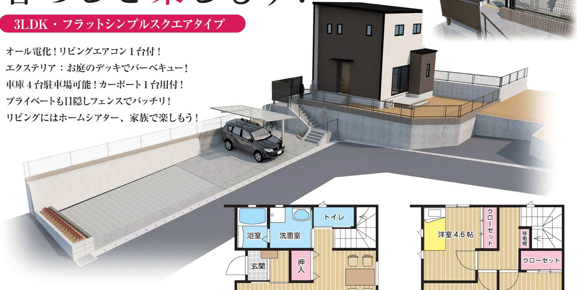
※完成イメージパース